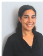
Salma Abdalle AUTLOOK Filmsales