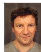
Joachim Kühn Real Fiction Filmverleih