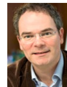
Cay Wesnigk AG DOK