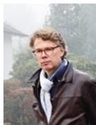
Ingo Fliess if... Productions