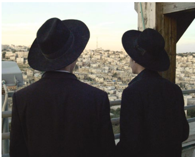
DER FALL ELOR ASARIA – Jüdische Stedler blicken über Hebron

Ein Soldat erschießt einen Attentäter. DER FALL ELOR ASARIA zeigt eine Spaltung der Gesellschaft: Ist der Soldat ein Held oder ein Mörder? KRIEG IM FRIEDEN setzt sich mit kritischen Stimmen zum israelischen Militär auseinander – und mit der Kritik an der Kritik. In einem kleinen Café in Tel Avivs lebendigem Flohmarkt-Viertel Jaffa lässt schließlich PUAAS ERBE all die Widersprüche auf Gemeinsamkeiten treffen.