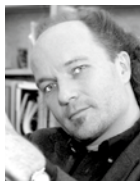
S. 16 Christian Frei Filmmacher und Präsident der Schweizer Filmakademie