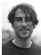
Christian v. Brockhausen NDR, DIE BOX