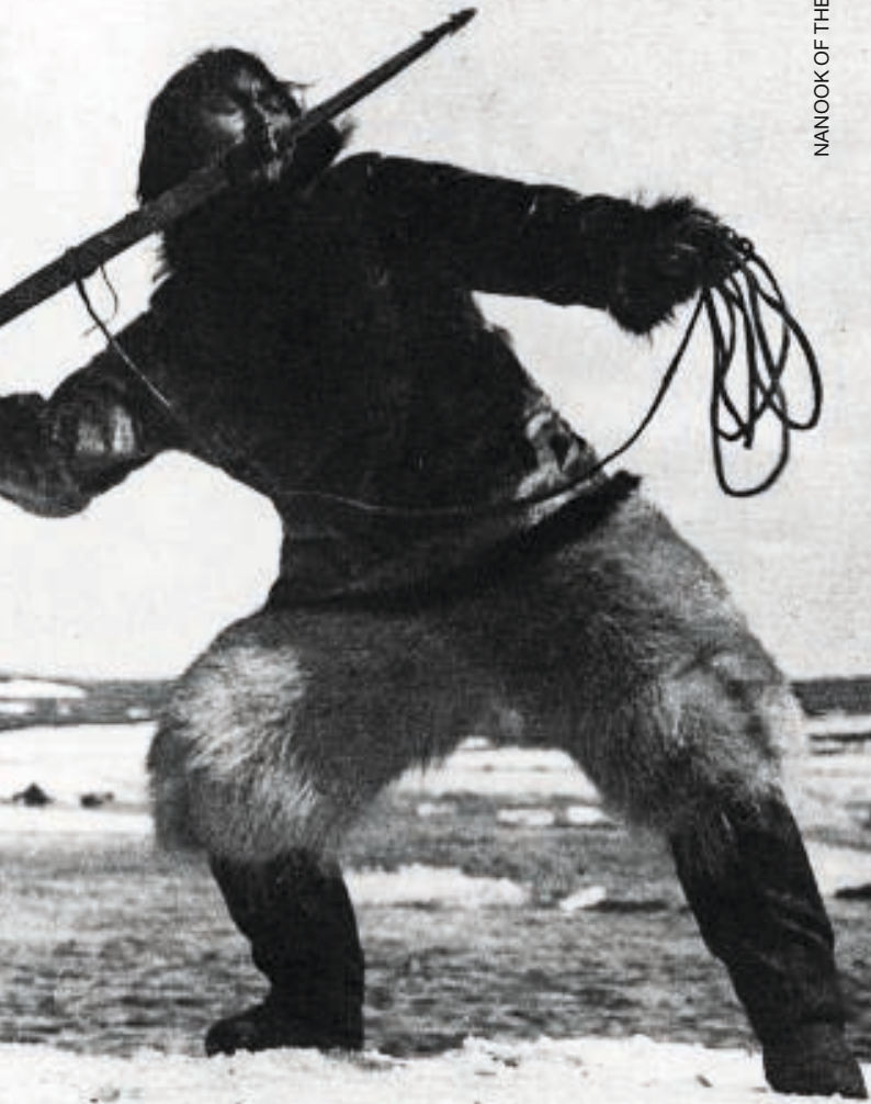
NANOOK OF THE NORTH (USA 1922, Robert Flaherty)