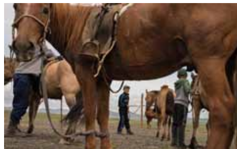
„Khuyagaa“ von Uisenma Borchu

Was bewirkt der Blick in die Kamera? Welche Wirkung hat eine besonders nahe Kameraeinstellung? Wie wird die Verbindung zwischen Mensch und Ort im Film hergestellt? Diese Fragen und einige mehr versuchen wir in diesem Workshop zu beantworten. Die Regisseurin Anna Wahle ist zu Gast.